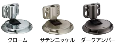
クローム サテンニッケル ダークアンバー