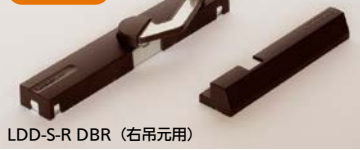
LDD-S-R DBR (右吊元用)