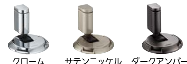
クローム サテンニッケル ダークアンバー